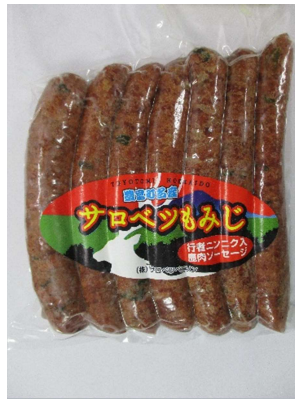
ソーセージ (行者にんにく入り) (800円)