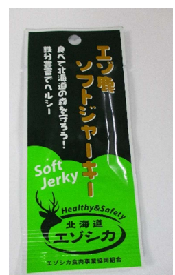
ジャーキー (常温品) (120円)