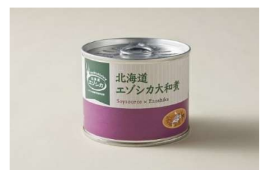
鹿(エゾシカ)商品は、缶詰・ペットフード等々どれも売行きが好調です。