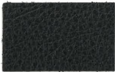
D-100 ブラック (Black)

いずれも鳥獣被害対策として捕獲された鹿で、捨てられているものを少しでも有効活用し“動物の命をムダにしない”という日本古来からの「マタギ」の精神を大切にし貴重な資源の有効活用に取り組んでいます。