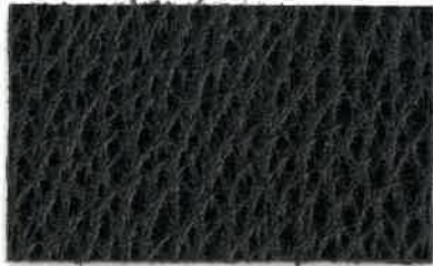
M-100 ブラック (Black)

※ご注意※ ロット内での色ブレが少々ございます。 また、少々の色落ちがございます。