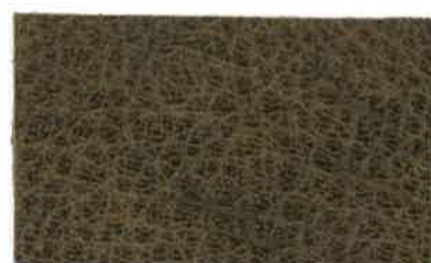
M-105 カーキ (Khaki)