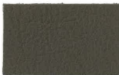
D-102 カーキ (Khaki)