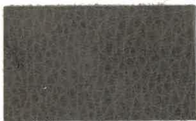
M-106 グレー (Gray)