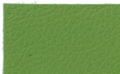
D-203 フォレストグリーン (Forest Green)