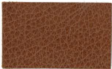
M-102 ブラウン (Brown)