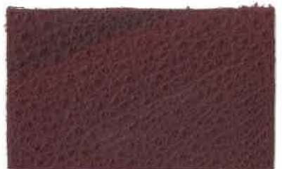
D-105 ワイン (Wine)