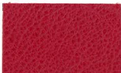
D-202 クリムゾンレッド (Crimson Red)