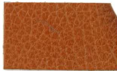
M-103 キャメル (Camel)