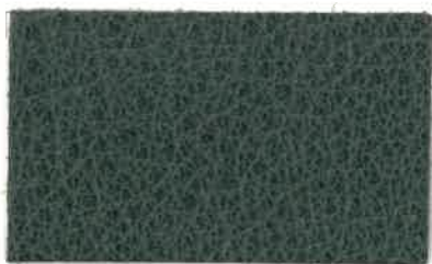
M-202 ボトルグリーン (Bottle Green)