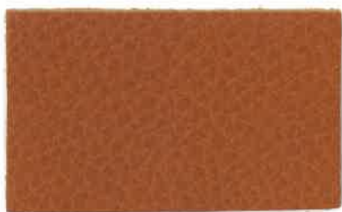
D-104 ブラウン (Brown)