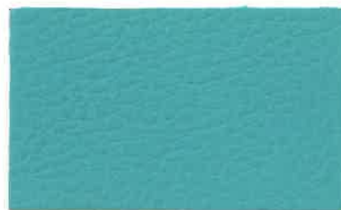
D-201 ターコイズ (Turquoise)