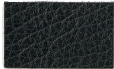
M-101 ネイビーブルー (Navy Blue)