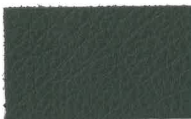
D-205 グリーン (Green)