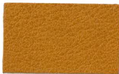
M-201 マリーゴールド (Marigold)