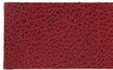
M-203 スカーレット (Scarlet)