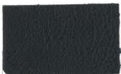
D-204 インディゴブルー (Indigo Blue)