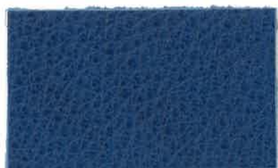
D-206 R・ブルー (R-BLUE)