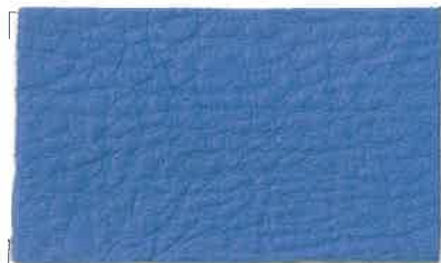
D-200 ロイヤルブルー (Royal Blue)

※ご注意※ ロット内での色ブレが少々ございます。 また、少々の色落ちがございます。