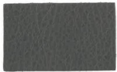
D-103 ダークグレー (Dark Gray)