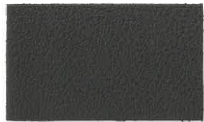
D-101 ダークブラウン (Dark Brown)